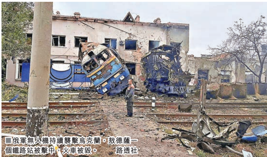
■俄軍無人機持續襲擊烏克蘭，敖德薩一個鐵路站被擊中，火車被毀。

美國媒體報道，總統特朗普政府已同意國防部及情報機構，向烏克蘭提供俄羅斯境內情報，支持烏對俄境內能源基礎設施發動遠程導彈襲擊。此舉被視為美國加大對烏支持力度的重要政策轉變，可能顯著影響俄烏衝突局勢，俄方警告此類行動將導致衝突升級。