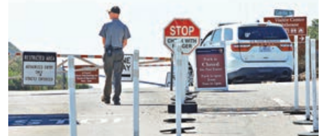
■加州卡布里略國家紀念碑因停擺而關閉，一名公園管理員守在入口處。

共和黨參眾議員批評民主黨阻撓法案通過導致僵局。民主黨領袖舒默反擊，指控特朗普與共和黨拒絕保障醫療保險才引發危機，並譴責凍結紐約基礎建設資金將導致數千人失業。