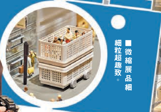
微縮展品細粒超趣致。