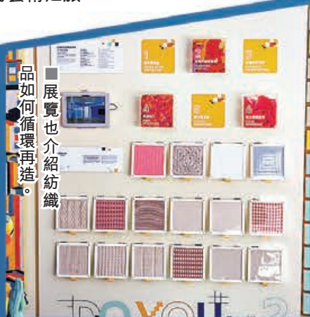
展覽內的懷舊針織小舖。