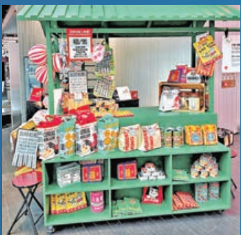
針織作品好有創意。