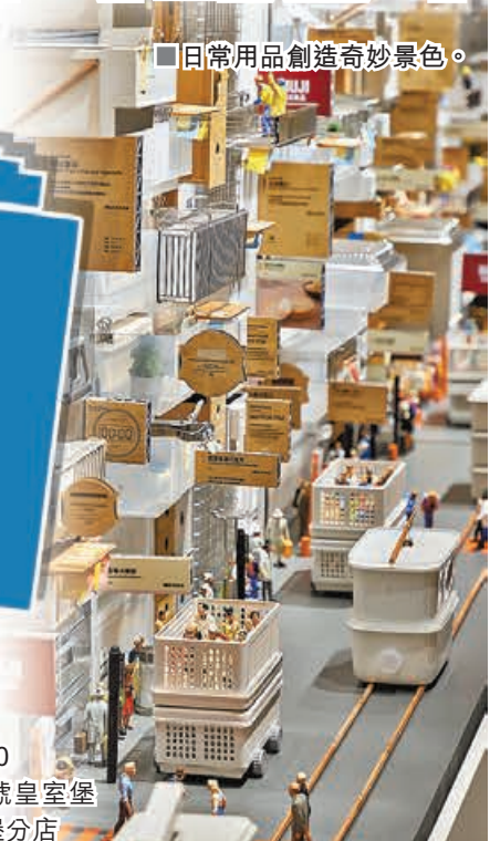
日常用品創造奇妙景色。