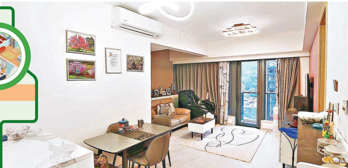
■客廳夠大，自成一角。