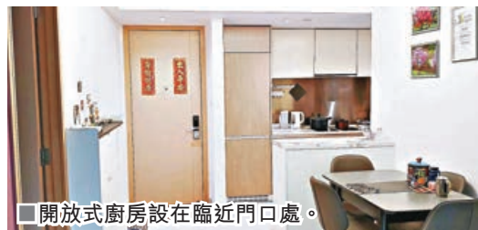
■開放式廚房設在臨近門口處。

另外，該行最新錄大埔天鑽13座中層F室交易，單位實用面積524平方呎，兩房間隔，議價後以608萬元沽出，實用呎價11,603元。新買家為家庭客，見單位價錢合理，即決定購入單位自用。