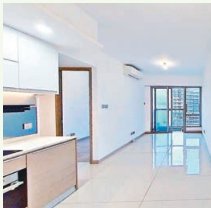
■長方形大廳配合開放式廚房。