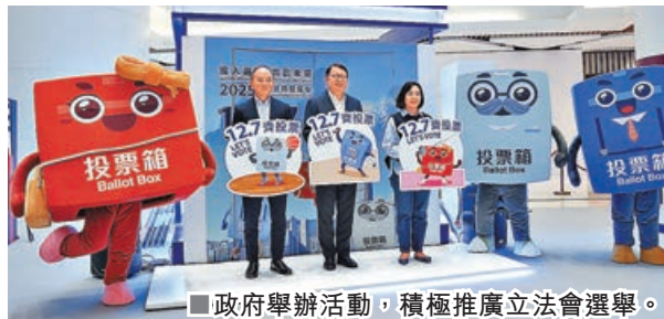
■政府舉辦活動，積極推廣立法會選舉。

本港將於12月7日進行第八屆立法會選舉，屆時全港選民均可投下自己手中關鍵一票。近日，社會各界都紛紛呼籲選民踴躍投票，履行社會與公民責任。行政長官李家超更在立法會選舉啟動禮上指出，這次選舉是關乎每一位市民的大事。為什麼這次選舉與你我息息相關？立法會議員將會如何選出？本文整理相關資訊，讓各位讀者知多啲。