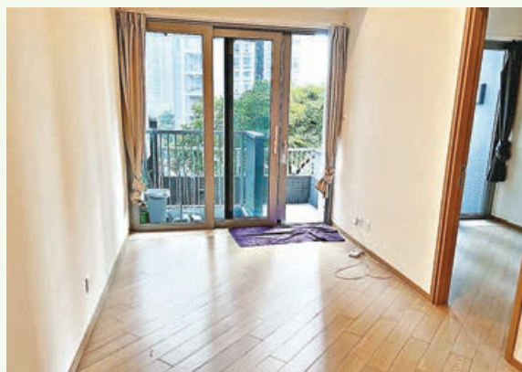
■ 大廳可直達露台，光線充足。