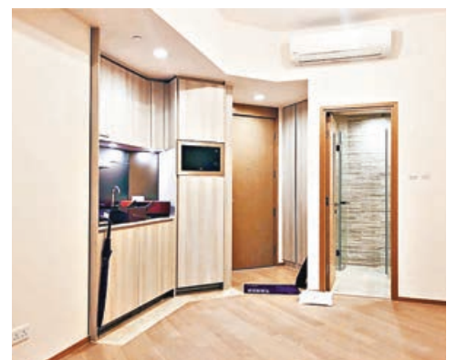
■ 臨近大門設有開放式小廚。