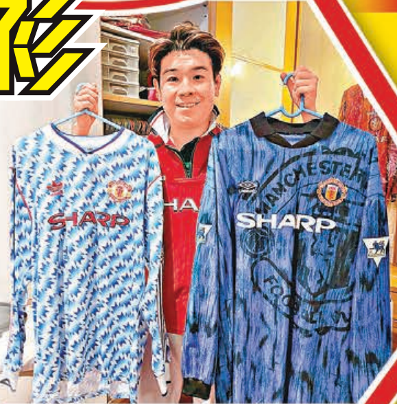
■曼聯在90-92球季及92-94球季的第一作客球衣，亦是Henry的珍藏。