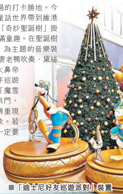
■「迪士尼好友巡遊派對」裝置