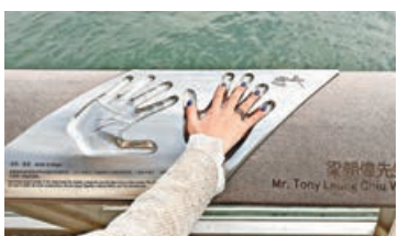
■星光大道必拍的手印照。

星光大道是香港電影文化的標誌性景點，沿維多利亞海岸線而建，是遊客必訪之地。這條全長400米的海濱長廊，匯集了數百位香港影壇名人的手印與簽名，遊客在欣賞維港景致的同時可留下與偶像手印的合影，重溫香港電影的黃金時代。沿海岸線前行，不遠處便是K11 MUSEA。這座融合了藝術、人文、自然三大元素的文化地標，是近年來的網紅打卡點之一。不僅館內常設40多件藝術藏品，更不定期舉辦各式特色展覽與活動，近