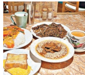
■紅茶冰室的經典港式美食。