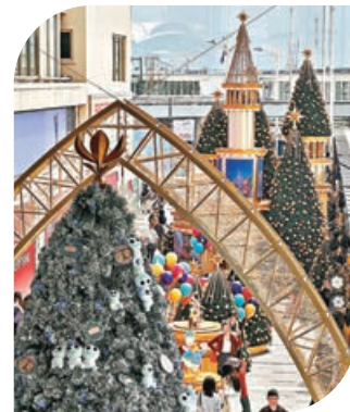
以絕佳機位打卡海港城聖誕裝置。