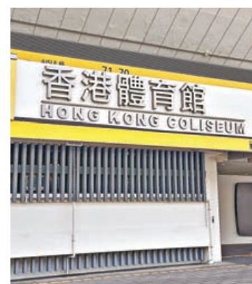
■香港體育館是香港最具代表性的演出場館之一。