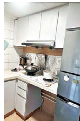
■ 廚房可放置三門大雪櫃。

最新資料顯示，該行錄得豫豐花園11月二手成交共3宗，實用平均呎價為10,457元。