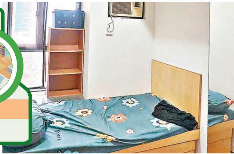
■ 小睡房的殼，放置單人床。