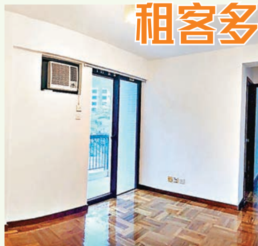
■ 客廳玻璃趟門連接小露台。