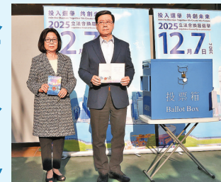
■李家超與夫人前日到票站投票。