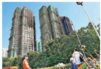
■宏福苑經歷大火後滿目瘡痍。

香港過往亦發生涉及整幢樓宇清拆重建的例子，舉例2010年土瓜灣馬頭圍道唐樓倒塌釀成4死2傷，最終由市建局向受影響的唐樓業主收購業權，收購建議每平方呎價為9,785元，屬市建局成立後在九龍區開展項目收購時的最