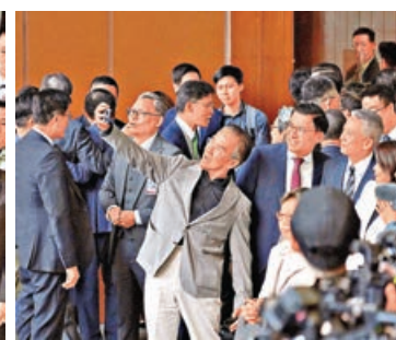
■田北辰與議員自拍留念。