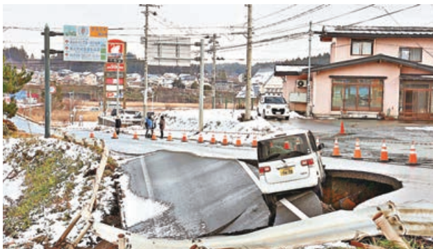
■青森縣東北町一輛汽車，陷入地震崩塌的道路邊緣。

日本本州東北青森縣東部海域周一（12月8日）晚間發生黎克特制7.5級地震，其後錄得多次4級以上餘震，截至周二晚間已導致至少50人受傷。北海道與東北4縣，即青森、岩手、宮城和福島縣一度有超過11萬人收到避難指示，需臨時前往避難設施。北海道新千歲機場亦受地震影響，部分天花掉落。