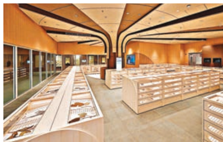
■中藥標本館展出約3,500份標本。

衛生署轄下政府中藥檢測中心永久大樓今日起分階段投入服務，新大樓引進高端科技和器材，進一步提升中藥檢測方法及標準開發能力，助力香港中醫藥全方位高質量發展。率先啟用的中藥標本館將展出約3,500份中藥標本，包括多份國家贈予香港的珍貴