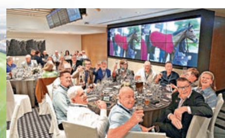
■旅行團享用馬場內餐飲設施。