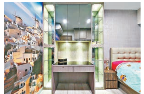
■房間內的玻璃裝飾櫃及書桌，甚具時代感。

談到裝修設計之精華部分，由於單位樓底只有八至九呎，於是設計師利用灰鏡和清鏡的通透反射作用營造更寬敞的視覺效果。另外，透過更改廚房間隔，加上貫通玄關位置，形成弧形的玄關區，輔以燈光及材質的配合，令訪客甫進門便感受到居所的豪華氣派。