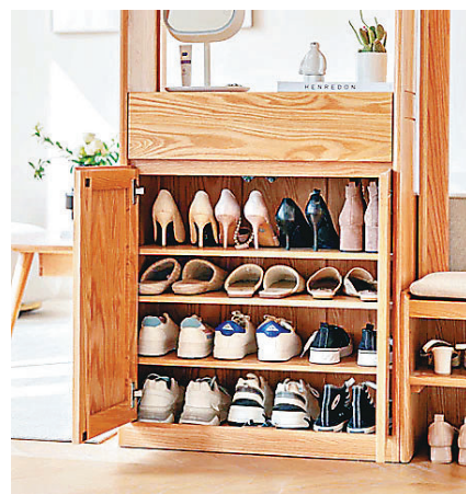
■組合玄關櫃包括鞋櫃及凳子等。

返到屋企，第一眼見到的就是所謂屋企的門面玄關了。專為香港家居細空間設計的「Prague（布拉格）組合玄關櫃」，以靈活組合和實用功能，幫大家打造一個整齊企理、兼顧收納與美感的入門空間。