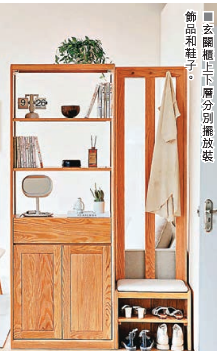
■玄關櫃上下層分別擺放裝飾品和鞋子。

布拉格組合玄關櫃採用標準化組件設計，你可以根據門口位大小和實際需要，自由搭配組合。無論是單獨擺放鞋櫃，抑或加裝衣架和軟凳，都能完美貼合你屋企的間隔，將每吋空間都用得剛剛好。