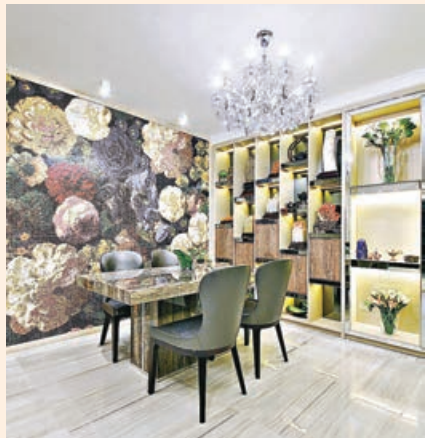
■由馬賽克砌成的花朵牆畫，成為飯廳的焦點。