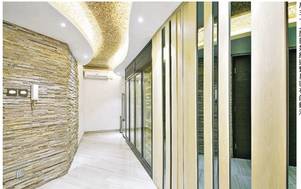
■玄關走廊天花鋪上大小不一的紙皮石，配搭波浪形燈槽，戶主一入屋就如經過繁星密布的銀河。