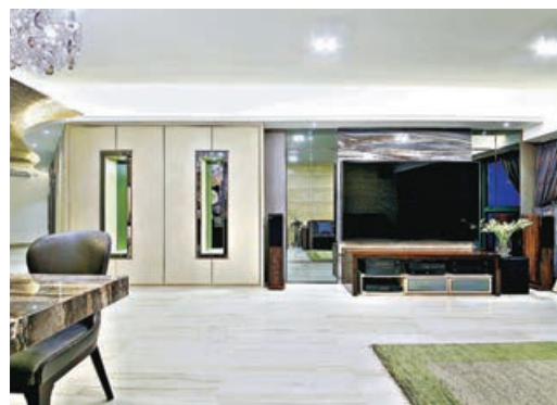
■大廳中間隱藏一道灰鏡門，門後正是各間睡房所在。