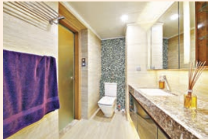
■廁所採用長方形雲石枱面，酒店式設備。