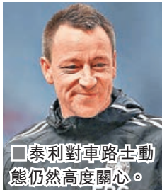
■泰利對車路士動態仍然高度關心。