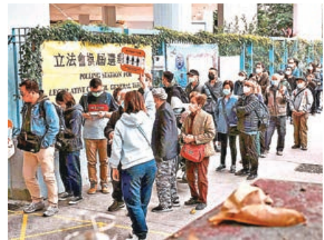
■市民在立法會選舉日踴躍投票。

立法會議員林健鋒表示，特區政府依法有效維護國家安全，全力拚經濟、謀發展、惠民生，並在應對突發事件時展現擔當，這些努力得到中央認可，令香港各界深感鼓舞。工商界及社會各界必將以實際行動，全力支持特區政府把握機遇，聚焦發展，加速推動香港實現更高質量發展。