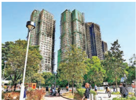
■宏福苑經歷大火後滿目瘡痍。

大埔宏福苑大火至今已逾半月，原定今日（17日）召開的立案法團管理委員會會議，因場地問題引發居民不滿而宣布延期。有業主家屬質疑，法團會議議題包括議決終止大維修工程承辦商和顧問公司合約，交由業主大會表決等，乃偏離重點，呼籲特區政府盡快介入以釐清責任，並規範法團運作，以防隨意動用業主資