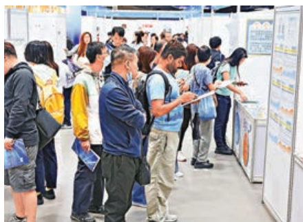
■市民可透過招聘會尋找合適工作。

政府統計處昨日發布最新勞動人口統計數字，今年9月至11月經季節性調整的失業率為3.8%，與8月至10月數據持平，就業不足率亦維持於1.6%，連續兩期保持不變，失業人數則減少5,200人。勞工及福利局局長孫玉菡認為，香港經濟穩健擴張，加上消費信心改善，應會繼續