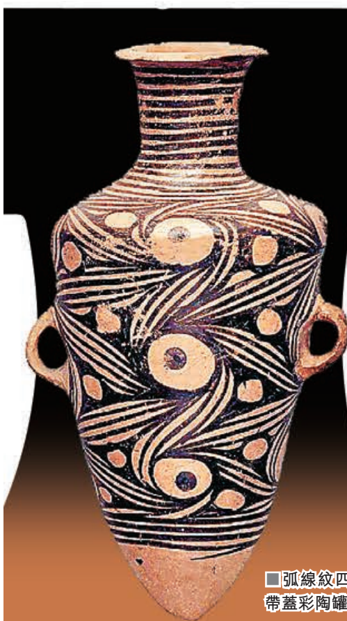
■弧線紋四寶帶蓋彩陶罐

深圳近期迎來兩場重量級藝術展覽，分別從未來哲思與遠古文明兩端展開對話。《墟構：未來遺跡》於海上世界文化藝術中心登場，由冰島藝術家 Sruli Recht 打造，融合科技藝術與哲學思辨，帶來沉浸式多感官體驗；而「彩陶藝術之巔峰——馬家窯文化彩陶特展」則於深圳美術館展出，呈現 59 件珍貴彩陶文物，追溯中華文明源流。兩展並陳，古今交織，為觀眾開啟一場跨越時空的文化探索之旅。