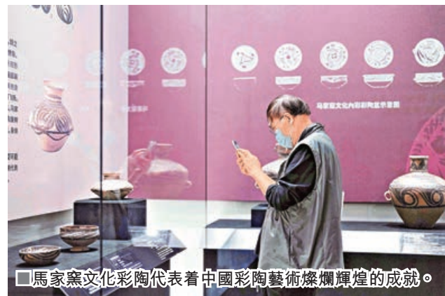
■馬家窯文化彩陶代表着中國彩陶藝術燦爛輝煌的成就。