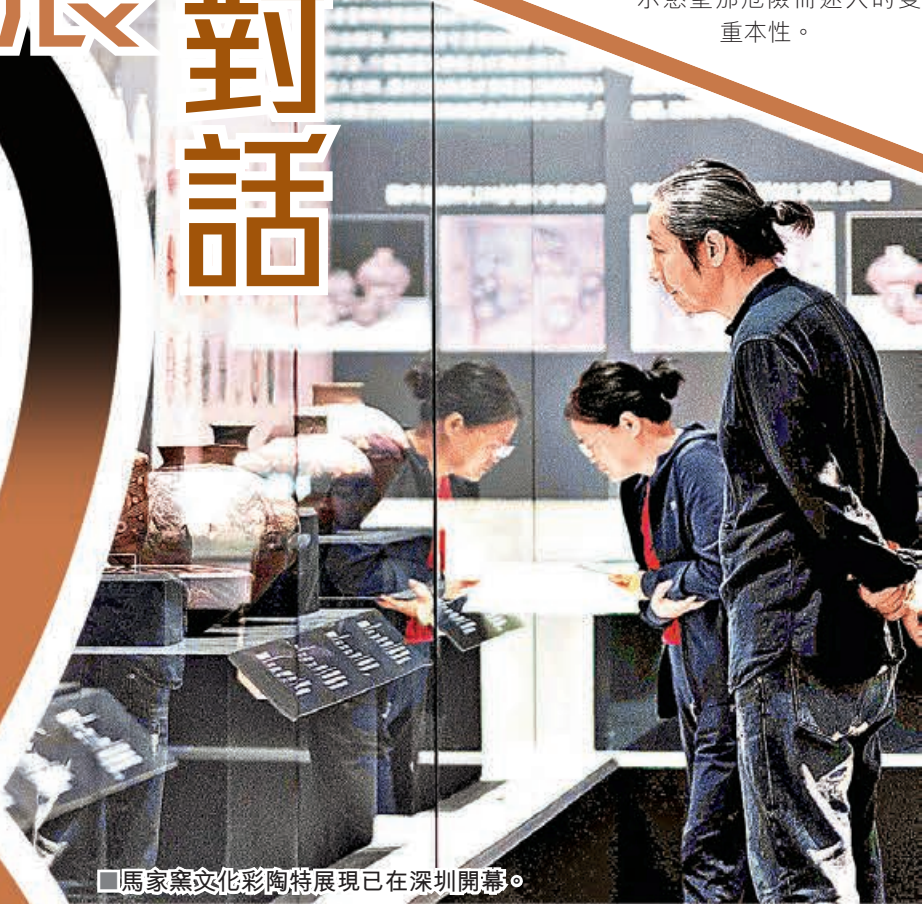
■馬家窯文化彩陶特展現已在深圳開幕。