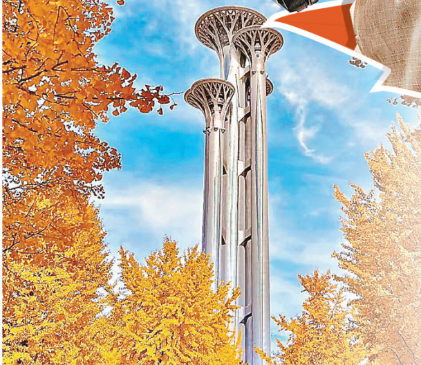
■奧森公園的銀杏樹。