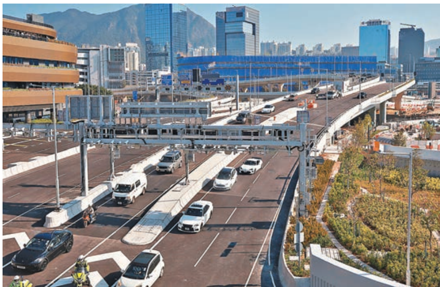
■陳茂波指出，香港的公共交通系統全球排名第一。