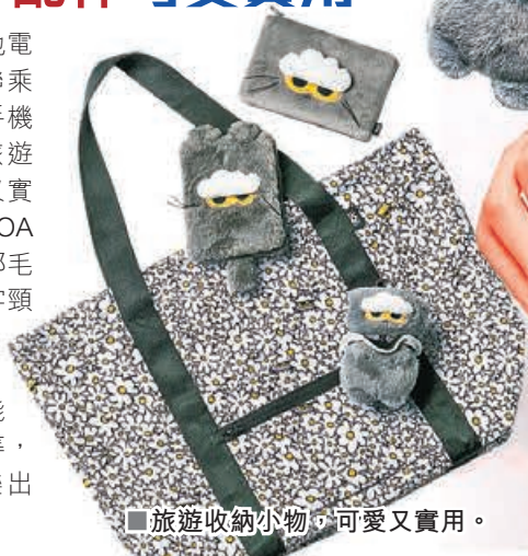
■ 旅遊收納小物，可愛又實用。

ZO&FRIENDS 和本地電子配件品牌 CASETiFY 聯乘可愛又時尚的配件，由手機殼、AirPods 保護殼到旅遊收納小物，全部都可愛又實用。當中人氣高的有「ZOA 毛毛公仔掛飾」，全身都毛茸茸的超萌 ZOA 戴上 C 字頸鍊，療癒得想讓人馬上帶回家。旅遊收納配件包括 ZOA 護照套、多功能收納包、可摺疊旅行袋等，讓可愛 ZOA 陪伴你快樂出遊。