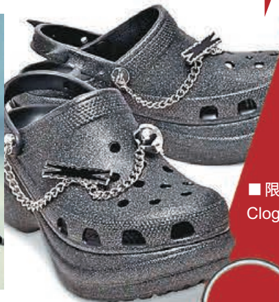
■ 限定版鞋款 Bae Clog 超型格。