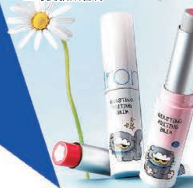
■ ZO&FRIENDS 與 rom&nd 聯名彩妝，化出精緻妝容。