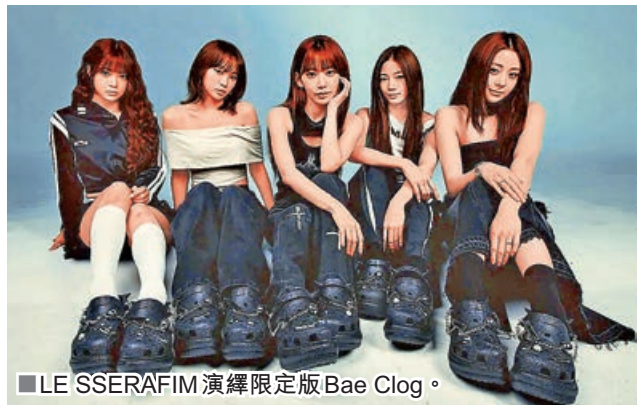
■ LE SSERAFIM 演繹限定版 Bae Clog。

實力女團 LE SSERAFIM 最近推出首張單曲專輯，還與舒適鞋品牌 Crocs 合作，推出限定版鞋款 Bae Clog，將「無懼」態度重新演繹。以經典 Crocs 鞋款為藍本，Bae Clog 升級加厚中底，營造 Oversized 輪廓，充滿 Y2K 風格。選用閃黑漆皮鞋身，後跟鑲嵌金屬飾片，鞋款大膽融入金屬鏈條與鉚釘細節，後跟更以惡魔尖角點綴，並將 LE SSERAFIM Logo 以金屬板全新演繹。鞋面配備五顆專屬吊飾，分別代表團體五位成員的個人符號，再串以金屬鏈條，閃耀又帶點叛逆。LE SSERAFIM 成員表示，希望從鞋款到「Jibbitz」專屬配飾的每個細節，都能向粉絲們講述她們的故事。