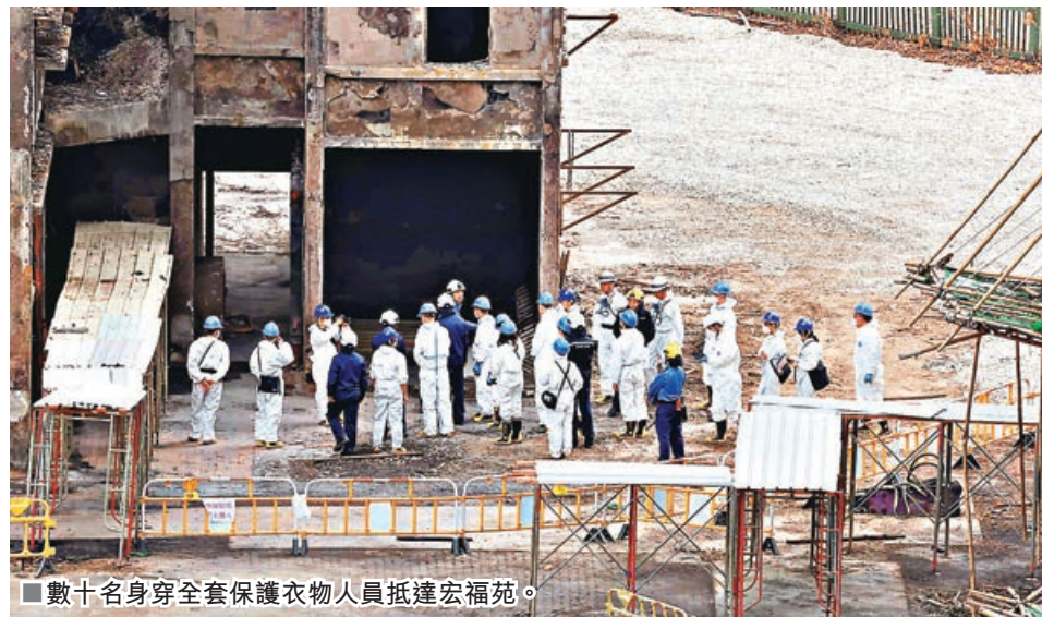
■數十名身穿全套保護衣物人員抵達宏福苑。