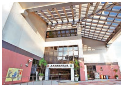
■瑪嘉烈醫院正進行擴建工程。

諾和工程懷疑偽造儀器校正證書，正調查其他四個負責的醫院工程是否都有造假。市建局亦發現在土瓜灣四個跟發展商合營的重建項目地盤，正採用諾和工程的測量儀器，其中兩個已確認偽造。