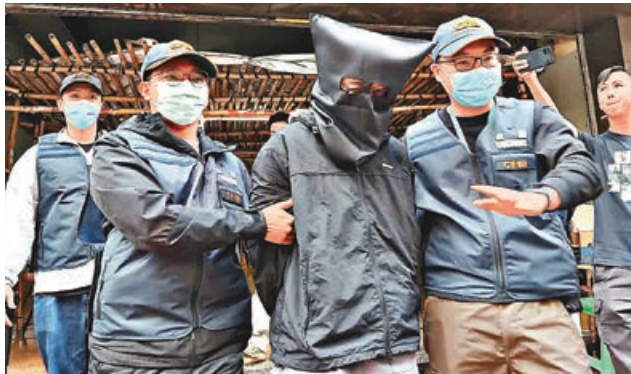
■疑犯被海關黑布蒙頭帶走。

海關人員搜查5名被捕人士位於北角和將軍澳的住所，以及他們在北角和太子的公司地址，檢獲多部手提電話、銀行卡、支票簿、一批稅務文件及虛假的貿易文件。他們名下合共約有5,500萬元的資產，已被即時凍結或由海關進行密切監察。