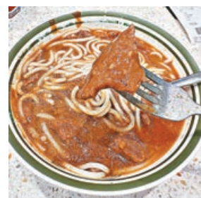
■招牌沙嗲牛肉口感嫩滑。