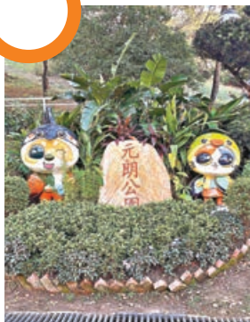
■元朗公園依山而建。