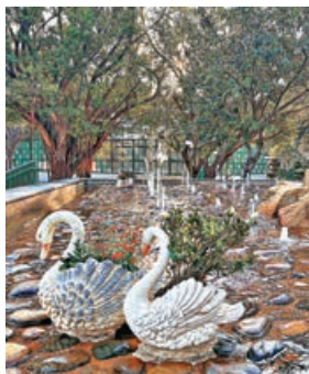
■元朗公園的噴泉水池。

搭乘K66巴士原路返回，在安康路站落車。這裏距離元朗公園不遠，可以順路過去參觀。元朗公園坐落於水牛嶺一片天然林地上，依山而建，並且廣植花木，景色優美宜人。來到公園的百鳥塔，