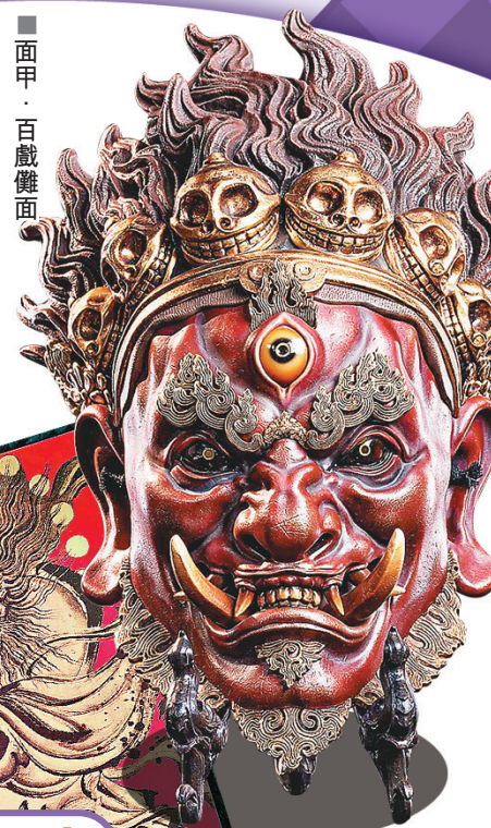
■神荼鬱壘年畫門神