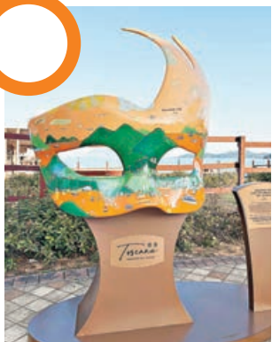
■海濱禮堂旁的面具裝置。

愉景灣酒店後方，屹立着香港首個臨海三角大禮堂。這座純白的海濱禮堂專門承辦婚禮，見證着不少新人共訂海誓山盟，也吸引無數情侶專程前來打卡，締造浪漫的美好回憶。高16米的三角幾何建築，別具典雅氣派，玻璃外牆映照出背後碧綠的山巒和湛藍的海面，將美景都收納其中。最為特別的當屬圍繞着禮堂四周的圓形淺水池，能夠倒映出純白禮堂和海天風光，站在水池邊打卡，輕鬆拍出水天一色的風景。