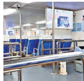
■免費搭乘輪渡返回中環。

愉景灣有全年通用的免費交通優惠，於指定餐廳、零售戶、愉景灣酒店餐廳酒吧、及愉景灣溜冰場單一消費收據滿指定金額（星期一至五每滿150元，星期六、日及公眾假期每滿250元），到愉景廣場禮賓部將優惠存入八達通卡內，憑該八達通卡於120分鐘內拍卡，即享同日由愉景灣返回市區之免費交通優惠。慳妹選擇了單價最高、速度最快、最方便的高速客輪（55.8元），只需約25分鐘即可到達中環。夜晚的海面漆黑一片，不過向北望去，可以看見遠處的迪士尼樂園燈火通明，彷彿童話中的夢幻國度，亮起燈的青馬大橋流光溢彩。