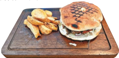
■雞肉、羊肉混合肉串(胖乎乎的麵包)