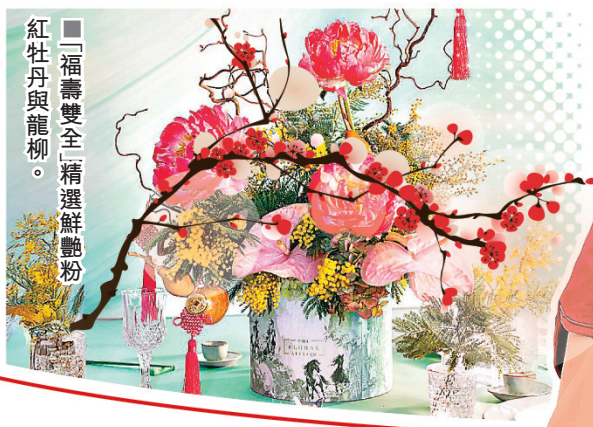
■「福壽雙全」精選鮮艷粉紅牡丹與龍柳。

橙福滿盈（1,780元）象徵豐收、興旺與喜悅，金黃柑果點綴其上，寓意吉祥如意，搭配金馬年特別版設計，盡顯節慶氣氛。而福壽雙全（3,280元）精選鮮艷粉紅牡丹與龍柳，盛放於翡翠馬年限量版花盒之中，寓意富貴、美麗與興旺。花藝設計高雅脫俗，祈願來年財運亨通、福氣臨門。由即日起至2月21日，更接受網上預訂及全港送遞服務，將福氣與安康直送到家。