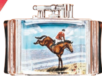
■重新演繹 Aquarium 打火機。