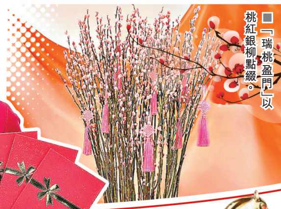
■「瑞桃盈門」以桃紅銀柳點綴。