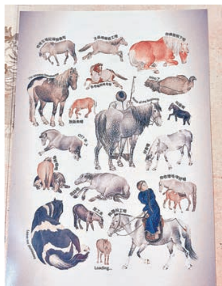
■趣味十足的馬年明信片。

之後可在旁邊的文創店挑選馬年明信片，其中有一款最為可愛，羅列近20種不同姿態的馬，並配上文字來描述馬兒不同動作表達的情感。例如一隻小馬在大馬身邊嗅聞，配文「你收埋咗咩好嘢」，畫