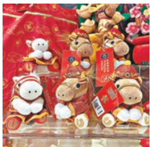
■「賀年小馬」喜慶可愛。騰。

馬年要行大運，當然不能錯過馬場。沙田馬場年味漸濃，吉祥物招財馬寶寶坐鎮大堂，為大家帶來好運。招財馬寶寶的左側擺有2024年香港馬王「浪漫勇士」使用過的馬蹄鐵，來到一定要摸一摸，接受冠軍級的好運。右側是幸運鈴，上手搖一搖，仲會增加今年的運氣。「馬場有禮」更上架了多款新年造型小馬公仔，讓你將好運帶回家。98元的「賀年小馬」迷你坐姿小馬公仔匙扣共有兩款，啡色的頭戴財神帽，寓意財源滾滾；米白色的身穿紅裙，耳邊還掛有一朵小花，十分喜慶可愛。另有常規大小的小馬公仔，售價238元，一款手持揮春，一款手持利是，增添新年喜慶氣息。此外，沙田馬場還將於大年初三舉辦連串