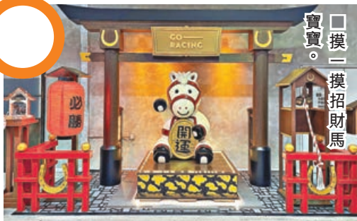
摸一摸招財馬寶寶。

馬年要行大運，當然不能錯過馬場。沙田馬場年味漸濃，吉祥物招財馬寶寶坐鎮大堂，為大家帶來好運。招財馬寶寶的左側擺有2024年香港馬王「浪漫勇士」使用過的馬蹄鐵，來到一定要摸一摸，接受冠軍級的好運。右側是幸運鈴，上手搖一搖，仲會增加今年的運氣。「馬場有禮」更上架了多款新年造型小馬公仔，讓你將好運帶回家。98元的「賀年小馬」迷你坐姿小馬公仔匙扣共有兩款，啡色的頭戴財神帽，寓意財源滾滾；米白色的身穿紅裙，耳邊還掛有一朵小花，十分喜慶可愛。另有常規大小的小馬公仔，售價238元，一款手持揮春，一款手持利是，增添新年喜慶氣息。此外，沙田馬場還將於大年初三舉辦連串