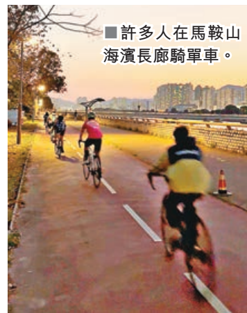
■許多人在馬鞍山海濱長廊騎單車。