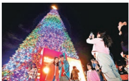
香港繽紛冬日巡禮