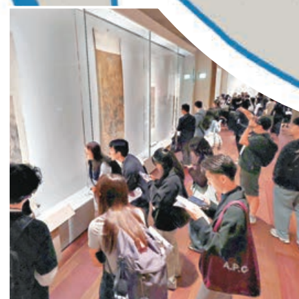
■今次展覽會展出大量珍品。

香港賽馬會主席廖長江表示，此次展覽是公益慈善研究院與故宮博物院五年合作計劃的重要一環，也是馬會馬年系列活動的亮點之一。馬會推出橫跨全年的多元文藝和社區項目，讓全城共慶同歡，推動本地旅遊，並促進馬匹運動和體育發展。