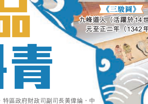
《三駿圖》 九峰道人（活躍於14世紀） 元至正三年（1342年）

是次展覽設「宮廷：行遊與騎獵」、「邊塞：鐵馬與烽塵」、「山澤：文思伴馬蹄」及「中西：駿馬騰古今」四個單元，從多維度展示中國馬畫藝術的豐富多彩。展品涵蓋明代「四大家」仇英、清代傳教士郎世寧、海派畫家任頤、以馬畫馳譽中外的徐悲鴻等名家真跡。