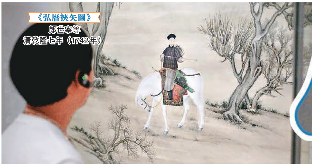
《弘曆挾矢圖》 郎世寧等 清乾隆七年（1742年）