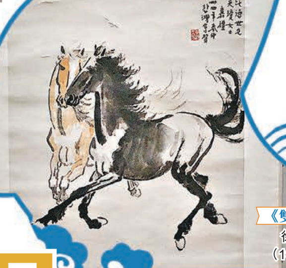
《雙馬圖》 徐悲鴻 （1945年）