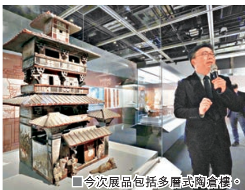
■今次展品包括多層式陶倉樓。