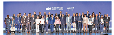
■世界各地文藝機構領袖出席高峰論壇。