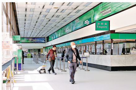
■香港郵政調整郵費以彌補營運成本上升。

真正解決虧損問題，期望香港郵政未來重新定位其角色，從傳統郵差轉向更具競爭力的物流與政務服務平台，舉例拓展高附加值快遞、強化電商包裹網路、整合政府公共服務窗口等。