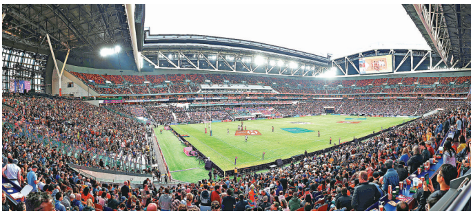
■啟德主場館曾舉辦多場國際體育盛事。