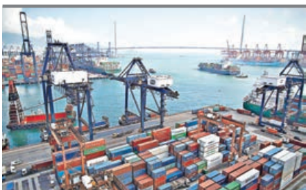
■ 恒生指，香港對外貿易未有因美國加徵關稅而受影響。

展望後市，盈立證券研究部執行董事黃德几表示，中東局勢持續緊張，港股後市或進一步下跌。從技術走勢與黃金比率分析，恒指最近一輪大升勢，是由去年 4 月 9 日的盤中低位 19,260 點，升至今年 1 月 29 日的盤中高位 28,056 點，累升 8,796 點，若回吐 50% 升幅，恒指將跌至 23,658 點，大市短期內或下試 23,600 點水平。