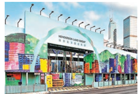
■ 恒地去年基礎盈利跌 38%。

另外，系內恒基發展 (0097) 去年虧損收窄至 6,700 萬元，2024 年則蝕 1.25 億元。去年每股基本虧損 2.2 仙，不派末期息。