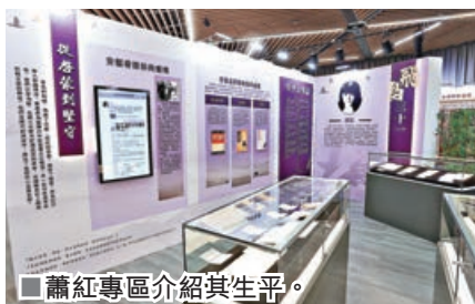
■蕭紅專區介紹其生平。