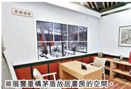
■展覽重構茅盾故居書房的空間。