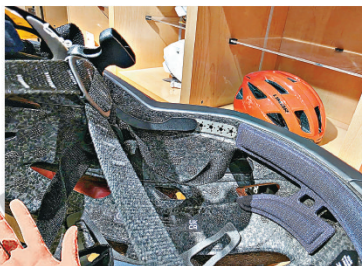
■單車頭盔多數設有調校系統，能夠微調貼合不同頭形。

他又提供選購頭盔的「貼士」：「不少歐洲品牌的頭盔版型較窄，戴上後太陽穴位置會夾得太緊，但後腦又太鬆。可以留意選擇有亞洲版型的頭盔，設計會較圓及較深，佩戴時頭部可貼到最頂、邊緣貼合於太陽穴側，不會搖晃鬆動便是適合。頭盔亦有不同的尺碼，內部通常亦有調校系統，可以微調至最貼合個人的頭形。」