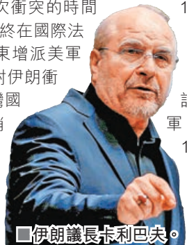
伊朗議長卡利巴夫。

萊維特稱，特朗普認為伊朗最好的選擇是達成協議，但美國仍未排除對伊朗發動地面行動的可能性，是次衝突的時間表仍為4至6周，美軍將始終在國際法的框架內行動。任何向中東增派美軍的行動，都不等於特朗普對伊朗衝突作出新決定。被問及海灣國家會否協助承擔衝突開銷時，萊維特表示，她不會在特朗普之前搶先表態，但她認為這確實是特朗普的一個想法。她援引1990年波斯灣戰爭期間，科威