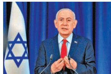
內塔尼亞胡拒對伊朗衝突解釋後續安排。

以色列總理內塔尼亞胡3月30日受訪時，拒絕為結束伊朗衝突給出具體時間表。內塔尼亞胡揚言，以色列對伊朗發起襲擊的目標，如今已實現了「一半以上」，但拒絕詳細解釋後續安排。