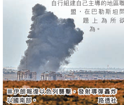
伊朗報復以色列襲擊，發射導彈轟炸以國南部。路透社

利維警告稱，以色列相信顛覆伊朗政權能令中東國家別無選擇，只能在美國的支持下，加強與以色列結盟，從而令以色列試圖自行組建自己主導的地區聯盟，在巴勒斯坦問題上為所欲為。