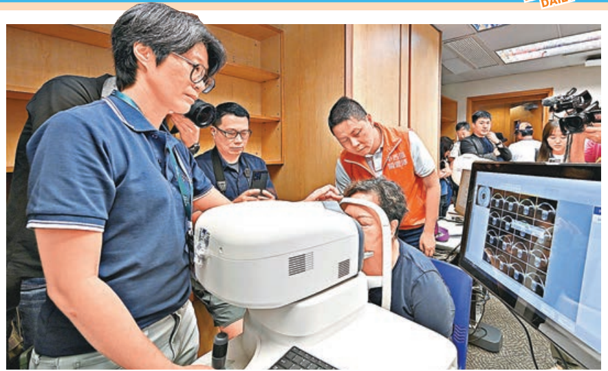
團隊為長者進行眼睛健康篩查。

運輸署回應表示，對營辦商稱調整收費需時並計劃縮減班次表示關注。署方至今未接獲該營辦商申請調整服務班次或收費。署方已提醒營辦商，如有司機因事或身體不適臨時缺勤，特別是居民上班和上學的上午繁忙時段，營辦商必須盡快安排後備人手提供服務，以盡量減少對乘客的影響並及時疏導候車乘客。