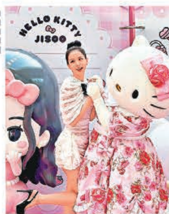
■ Jisoo與Hello Kitty互動超治癒。

杯、購物袋、行李吊牌等，還有40cm限量版公仔。公仔盲盒裏的Hello Kitty甜美可愛，還加入Jisoo的標誌風格，穿上珍珠小禮服，畫上長長的眼睫毛。Jisoo親自設計的角色「小灰塵SHUMON」也驚喜登場，成為盲盒公仔隱藏版之一。無論你是Jisoo還是Hello Kitty粉絲，都會在這次快閃的精品中感受到用心滿滿。