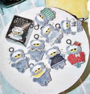
□「ZOA造型盲盒」系列可愛爆燈。