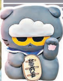
■ ZOA ART FIGURE (售價$618)