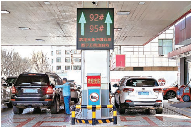
■青海西寧兩輛汽車在一間加油站加油。

為減緩國際油價上漲對國內的衝擊，國家繼續對成品油價格採取調控措施。記者從國家發展改革委獲悉，自4月7日24時起，國內汽、柴油（標準品）價格每噸上調420元（人民幣，下同）、400元。此次調價是短期內國家第二次出手調整成品油價格。中國海油集團能源經濟研究院院長王震表示，國家對成品油價格實施調控既要執行已有定價機制，又要統籌考慮市場供應保障和下游承受能力等多重因素，調價力度兼顧民生、產業、能源供應，一方面要避免價格異常波動對下游用戶的過大衝擊，另一方面要適當疏導原油進口成本，保障成品油穩定供應。