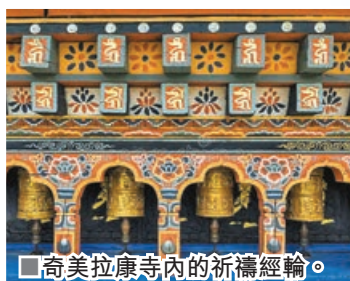
奇美拉康寺內的祈禱經輪。

不丹的奇美拉康 (Chimi Lhakhang) 是國際知名的求子聖地與佛教寺廟，位於普納卡區，該寺建於1499年，旨在紀念藏傳佛教僧侶「瘋聖」朱卡庫拉 (Drukpa Kunley)，他以特殊的方式降伏惡魔。寺廟內供奉的生殖崇拜像，被指擁有賦予生命的能力。在寺廟內參拜時，僧侶會用木雕或骨雕的陽具法器輕敲求子棍的頭頂，象徵賜福。