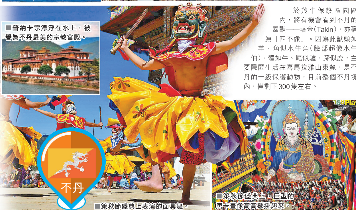
策秋節盛典上，巨型唐卡畫像高高懸掛起來。

策秋節 (Tshechu) 是不丹最盛大和最神聖的藏傳佛教節日，旨在紀念蓮花生大師的生辰與功德，慶典表演包含「面具舞」(Cham)、「烈火金剛舞」以及懸掛巨幅唐卡 (Thongdrel)，被視為民眾洗滌罪業、獲得祝福的儀式。策秋節主要舉辦地點之中，以廷布和帕羅兩地的策秋節規模最大和最熱鬧。對不丹人而言，一生至少要參加一次策秋節。今年已舉辦了兩次大型策秋節盛典，現只餘下9月21至23日舉行的秋季廷布策秋節。