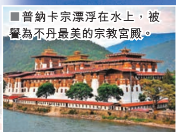
普納卡宗漂浮在水上，被譽為不丹最美的宗教宮殿。

普納卡曾是不丹的古都，至今仍是宗教與歷史的重要中心。壯麗的普納卡宗坐落於兩河交會之處，如漂浮在水上的宮殿，被譽為不丹最美的宗教宮殿。春日河岸盛開紫色藍花楹，美景如畫，是體驗不丹神聖與浪漫兼具氛圍的必訪之地。在2008年，不丹第五世國王加冕也是在普納卡宗完成。