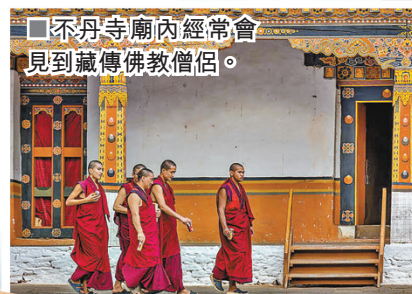
不丹寺廟內經常會見到藏傳佛教僧侶。

不丹虎穴寺 (Paro Taktsang) 最大特色是它坐落在其鬼斧神工的斷崖，建於海拔約3,120米的帕羅山谷懸崖壁上，呈現磅礴的懸空景色，它是藏傳佛教聖地、蓮花生大師降妖佛魔的傳說地，以驚險的建築構造和獨特精神信仰去弘揚藏傳佛教的世界十大名寺之一。