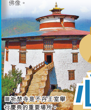
祈楚寺是不丹王室舉行慶典的重要場所。