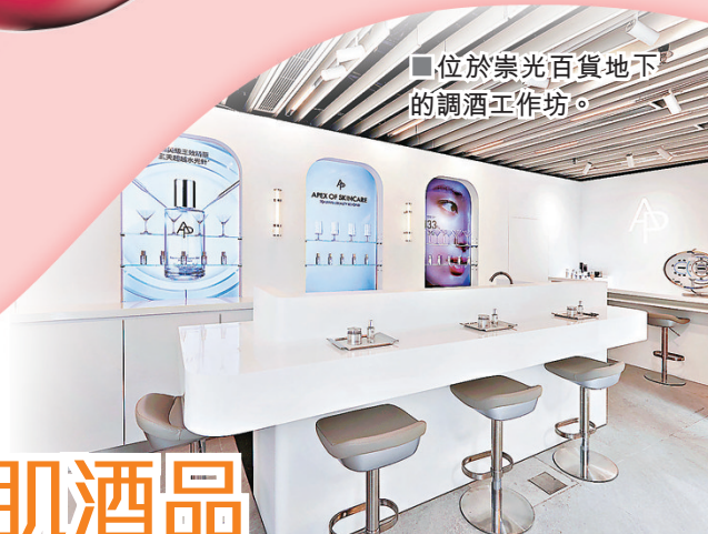
■ 位於崇光百貨地下的調酒工作坊。

M.D. 3-in-1 Skin Booster Cocktail Bar 地點：銅鑼灣崇光百貨地下 日期：即日起至 4 月 14 日