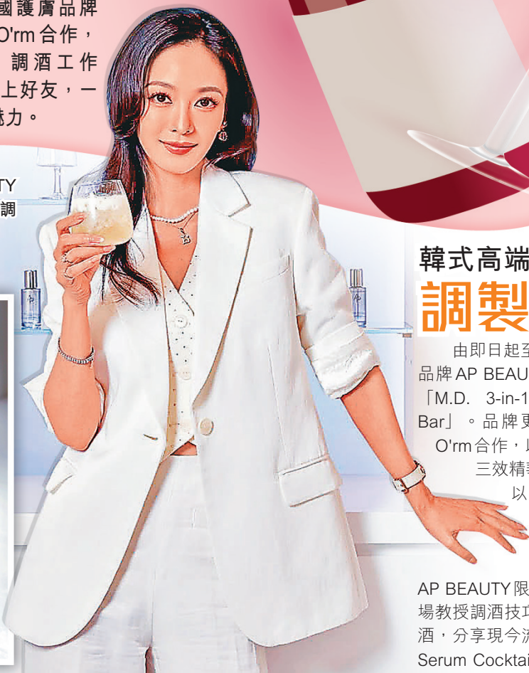
■ 品嘗 AP BEAUTY 限定雞尾酒，享受調配樂趣。

想慶祝特別的日子，或結束忙碌的一天，與好友去酒吧享受一杯特調雞尾酒，絕對是不二之選。適逢本港最近有不少快閃酒吧活動，包括意大利朱古力與意式雪糕品牌 Venchi，與創意雞尾酒吧 The Savory Project 攜手打造期間限定「Cremino Bar」。韓國護膚品牌 AP BEAUTY 與韓式小吃酒吧 O'rm 合作，舉辦「M.D. Serum Cocktail」調酒工作坊。如果你鍾意嘗鮮，不妨約上好友，一起去感受這些跨界聯乘酒吧的魅力。