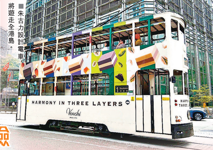
■ 朱古力設計電車將遊走全港島。