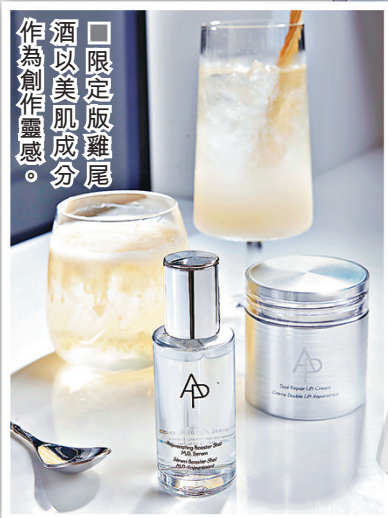
■ 限定版雞尾酒以美肌成分作為創作靈感。