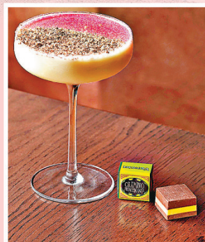
■ Pistachio Fizz

此外，Venchi 與本地塗鴉藝術家 Alex Croft 聯手，將充滿人文氣息的中環卑利街改造成 Venchi 朱古力世界。大家亦可以與銅鑼灣及尖沙咀街道上的朱古力郵筒打卡。同款設計的電車亦將遊走全港島，透過藝術色彩讓眼睛嘗盡 Cremino 朱古力的無限魅力。