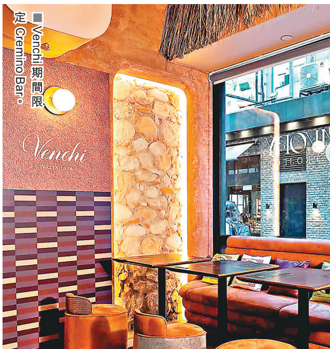
■ Venchi 期間限定 Cremino Bar。