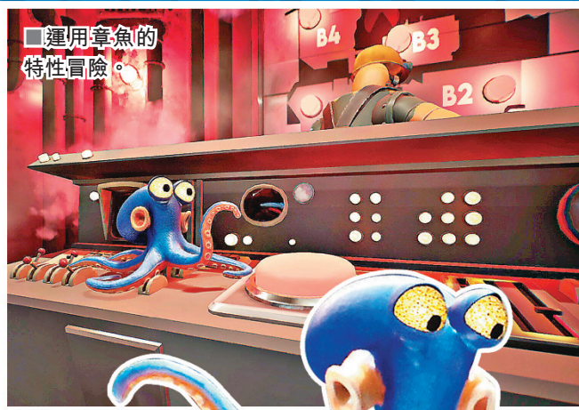
■運用章魚的特性冒險。

遊戲擁有卡通的美術風格、細緻的海底世界及工業廢墟刻畫、靈動的配樂音效以及電影級的鏡頭語言，遊玩過程堪比觀看一部製作精良的動畫電影。如果你是迪士尼電影《海底奇兵》的忠實粉絲，那麼一定不能錯過在這部《達爾文悖論》中親身擔任主角，化身超萌的章魚達爾文，展開一場輕鬆幽默的海底世界冒險。《達爾文悖論》可在 PS5、NS2、Xbox Series X|S 及電腦上遊玩，售價 198 元。