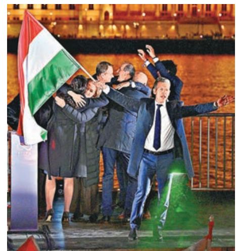
■毛焦爾勝選後，手持匈牙利國旗與黨友慶祝。

中國外交部發言人郭嘉昆13日在例行記者會上表示，中方祝賀毛焦爾領導的蒂薩黨在新一屆國會選舉中獲勝。歐洲領袖紛紛對選舉結果表示歡迎。