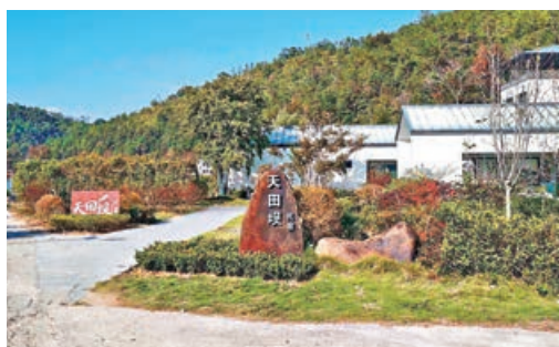
■樂村石樓附近環境清幽。