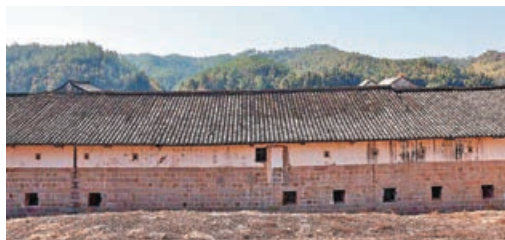
■歷經200多年的樂村石樓依舊挺拔規整。