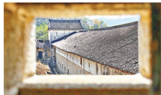
■石樓窗外視野自成一景。

樂村石樓的價值，不僅在於精湛工藝，更在於融合生存需求、官紳威儀與家族倫理，是清代中後期粵東官紳生活的縮影，也是張氏家族崛起的重要見證。作為省級文物保護單位，它是客家文化的重要載體，更是研究清代客家地區政治、經濟、建築藝術的珍貴資料。嘉慶二十三年救命碑、韓榮光賀聯等珍貴文獻，讓這段家族輝煌有跡可尋，也讓每一位到訪者都能在磚石間，讀懂張氏家族傳奇，觸摸粵東客家的歷史脈絡。