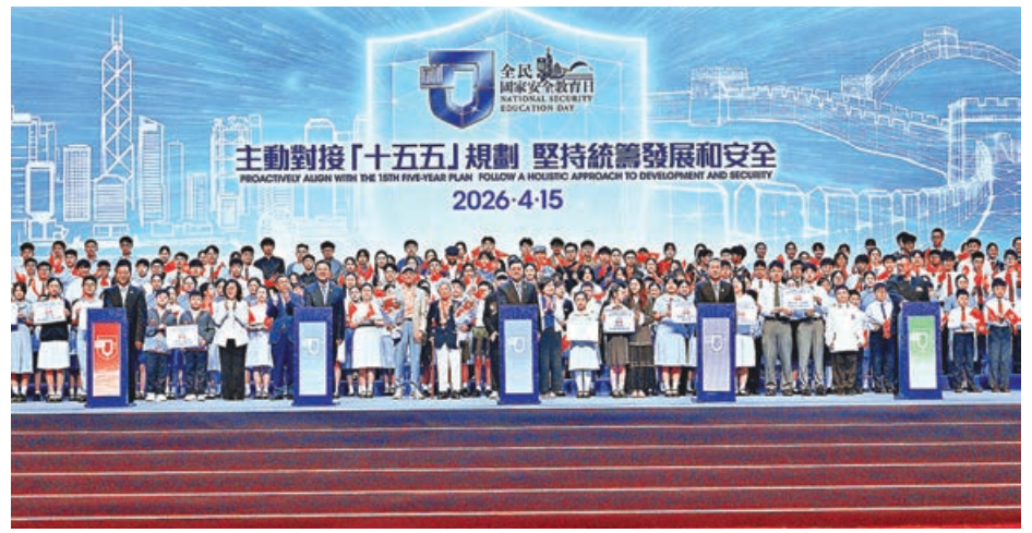
「全民國家安全教育日」開幕禮昨日舉行，各界逾2300人出席。