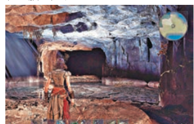
■來到地下洞穴尋寶。

雙桅小帆船，到全能雙桅帆船，再到龐大的巡防艦，打造最符合你風格的海上堡壘。除了建造基地與激烈海戰，遊戲中還有海盜主題不可或缺的尋寶元素。地圖中存在百餘處精心設計的地下城與藏寶點，身為最勇敢的海盜船長，玩家當然不能錯過充滿意外和驚喜的尋寶活動。《Windrose:風啟之旅》原價 187 元，首發九折優惠價 168.3 元，有效期至 4 月 22 日，可在電腦上遊玩。