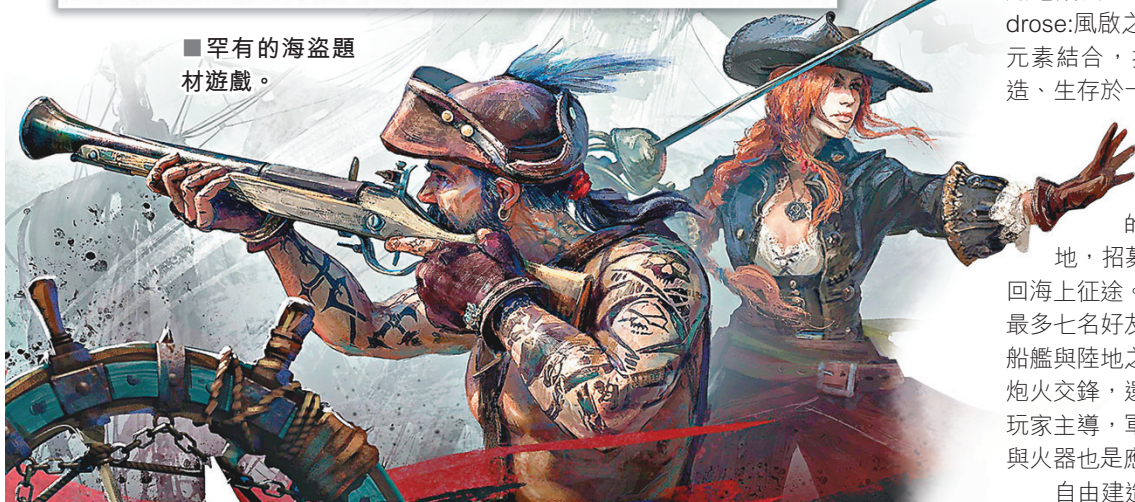
■罕有的海盜題材遊戲。