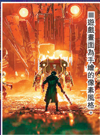
■遊戲畫面為手繪的像素風格。