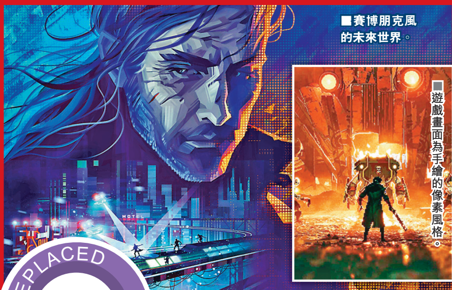
■賽博朋克風的未來世界。