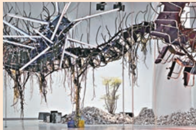
■由辦公椅組成的「機械脊骨」。