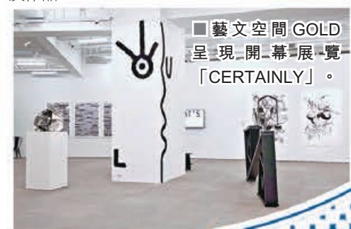
■藝文空間 GOLD 呈現開幕展覽「CERTAINLY」。

他相信 GOLD 將成為香港一處極具實驗性的空間，同時結合商業和非商業內容。除呈現本地藝術家的獨特之處，他也希望以這次展覽為開端，向香港引薦越來越多的非本地藝術家及作品。