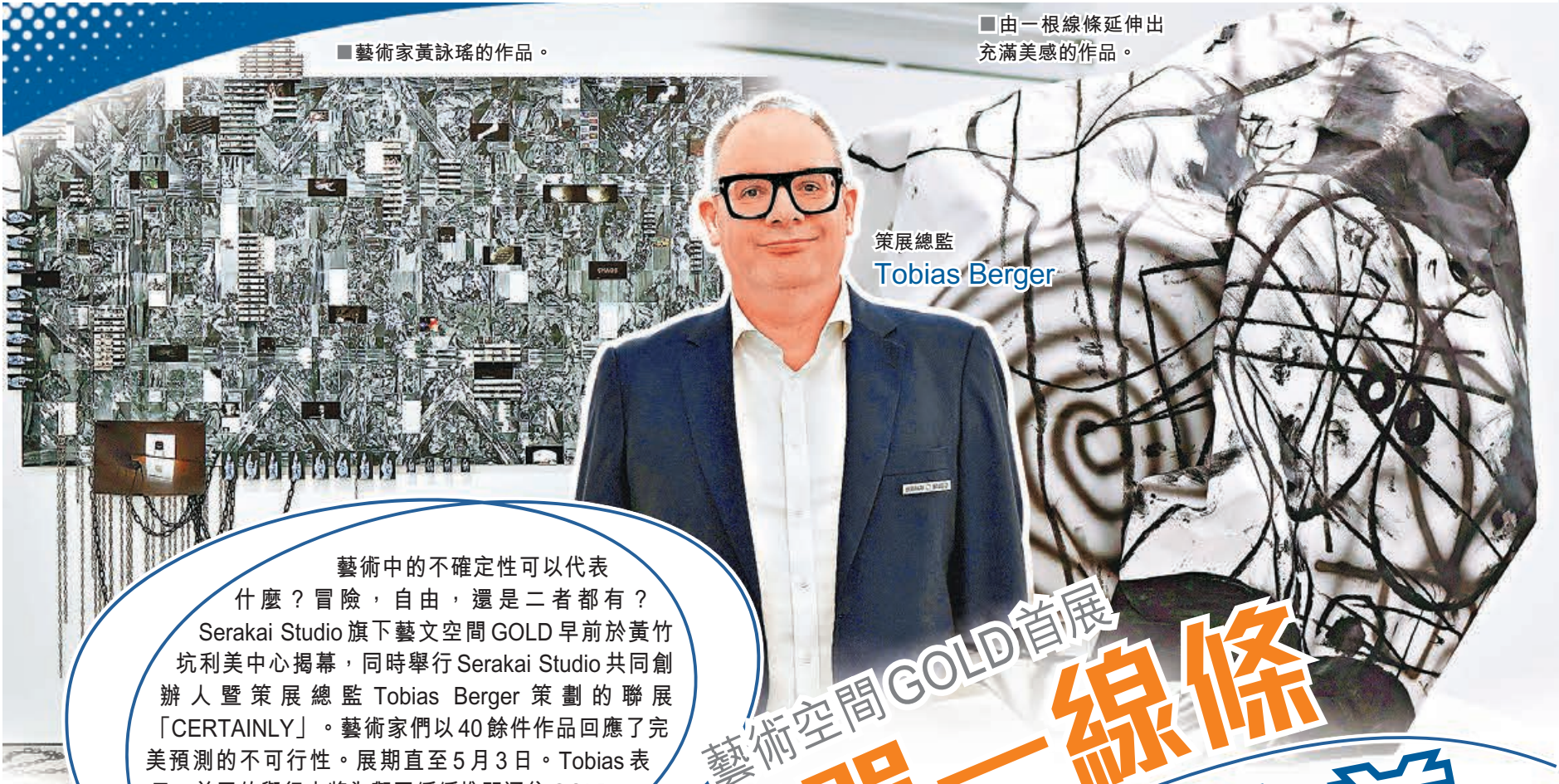
■藝術家黃詠瑤的作品。