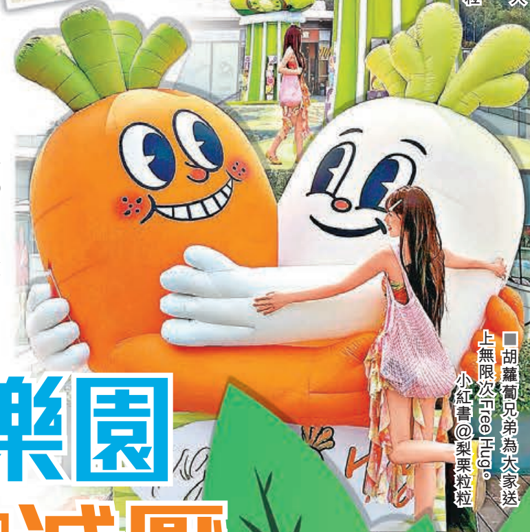
■胡蘿蔔兄弟為大家送上無限次Hello。 小紅書@梨栗粒粒

開 業接近兩年的大運天地位處深圳龍崗區，無論在福田口岸、羅湖口岸乘地鐵也要轉乘兩次才可到大運中心站，同時亦要約1小時車程。若果大家有2、3位朋友同行，可在蓮塘口岸預約網約車前往，花費不用¥100即可直達，是性價比最高的選擇。至於商場以「自然氣象」為主題，綜合約52萬平方米綠色空間與人工湖，令遊客心曠神怡，忘卻都市的煩囂。這個開放式商場主要是室外空間為主，有近200間商舖，包含餐飲、運動、休閒娛樂一站式消費，並有梅花鹿、黑天鵝等動物「駐場」與大家互動，可感受特色生態奇景。