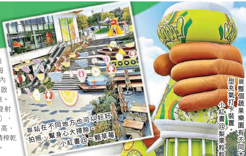
■站在不同地方也可以好好拍照，幫身心大掃除。 小紅書@一顆草莓

另一出片位中區爬梯廣場（中區覓書店旁）的「不熟時刻的爬梯」，大大小小的青、紅蘋果如音符般散落在石屎樓梯側，是大家最佳的打卡背景；南區環形廣場的「被嫌棄的花園」亦是必到影相位，穿過可愛的水果拱門，進入安靜的環形花園，停下腳步，感受被多巴胺包圍的感覺，置身其中發發呆，肯定十級治愈。另一邊廂，「NICE MOOD 果蔬市場」，有哈哈鏡等大家；而市場中的「胡蘿蔔兄弟」是兩隻充氣胡蘿蔔互相擁抱，遊客站在前方加入齊齊抱抱，所有鬱悶心情一掃而空。還有在南區湖畔的「百果交雜碼頭」，香蕉、蘋果、茄子、楊桃、橙、所有水果大集合，大家望住不同裝置散散步，感覺愉悅又放鬆。