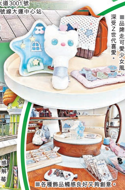
■各種飾品觸感良好又夠創意。