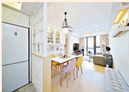
■大廳與廚房利用文化石與格子玻璃窗取代原來的實牆間隔。