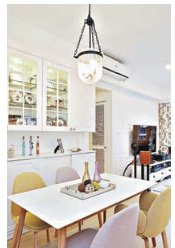
■白色餐桌和玻璃裝飾櫃，在燈光照明下很有柔和舒適感覺。

值得一提的是，設計師們將原先兩房合併成偌大的主人套房，與露台相連，為房間提供良好的採光條件，加建木紋地台明顯分隔睡眠區，令收納空間增加之餘，亦是舒適閒坐的地方，也好讓戶主好好欣賞窗外景色。