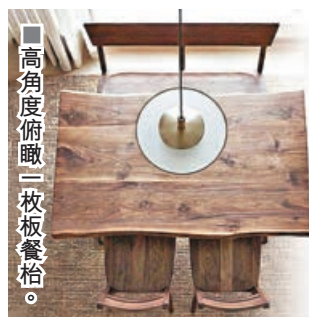
■高角度俯瞰一枚板餐枱。

一枚板餐枱有幾珍貴？試想，一家人和親友們圍坐餐枱吃晚飯、打邊爐，手摸着獨一無二的天然木紋，以及大自然引入的彎曲邊沿手感，這種就是主人家的氣派！一枚板每一塊都獨一無二，生長過百年才有這份獨一無二的紋理。