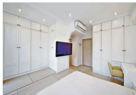
■主人套房是由兩房拼為一房，採用地台床和兩組頂身衣櫃，大大增加收納空間。