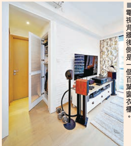
■電視背牆後側是一個百葉窗衣櫃。