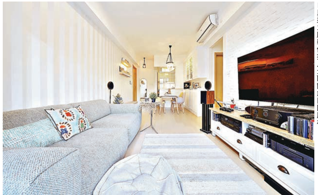
■巨型大廳裝修採用北歐簡約田園風格。