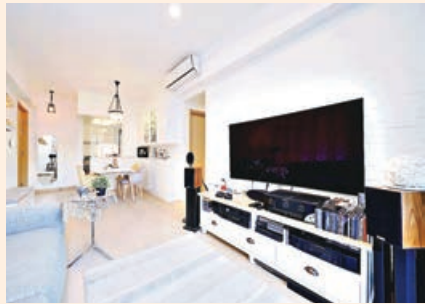
■客廳的電視背牆選用純白柔和色調。