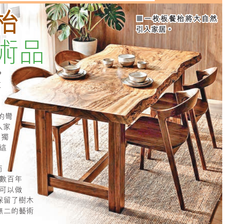
■一枚板餐枱將大自然引入家居。

所謂「一枚板」，簡而言之即是「原木直切，絕無拼接」的木板。它是選自生長數百年的大樹樹幹，經完整切割而成的一整塊實木。配上腳座就可以做餐枱或書枱，有別於市面上常見的拼接木材，一枚板完美保留了樹木天然的紋理、年輪與獨特的形態。每一塊皆是大自然獨一無二的藝術品，在世上絕無僅有，無法複製。