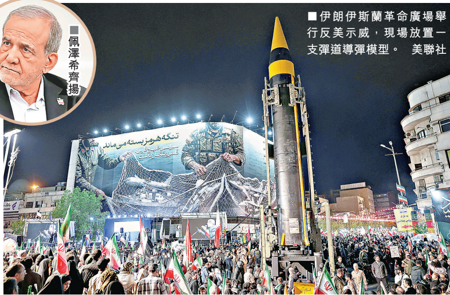
■ 伊朗伊斯蘭革命廣場舉行反美示威，現場放置一支彈道導彈模型。

特朗普當天接受霍士新聞台訪問，否認他為挽救中期選舉岌岌可危的選情，急於結束當前衝突，堅稱美方對於停火「沒有任何時間壓力」。特朗普先前多次公開聲稱，美國針對伊朗的軍事行動只會持續4至6周。他還於21日聲明稱，美方應巴基斯坦請求會延長同伊朗的停火期限，直至伊朗方面拿出意見一致的方案。他又宣稱，雙方新一輪和平談判「很有可能」於未來36至72小時內舉行。《紐約郵報》還引述消息稱，談判最快將於24日展開，地點設於巴基斯坦首都伊斯蘭堡，由巴方繼續斡旋。