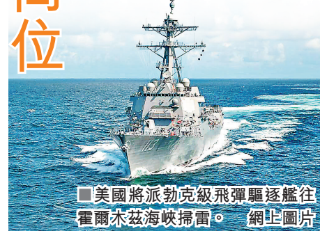
■ 美國將派勃克級飛彈驅逐艦往霍爾木茲海峽掃雷。

伊朗衝突推高全球油價，報道指出，這一時間表令國會兩黨議員都感到沮喪，這意味當前衝突對美國經濟、尤其是燃油價格造成的影響，可能會持續到今年晚些時候甚至更久。關於美國汽油價格何時才能回落，特朗普連日不斷變化說法，顯得搖擺不定。他曾承認到中期選舉時，汽油價格可能與衝突前持平或稍高，其後又改口稱汽油價格會在選舉前大幅回落。