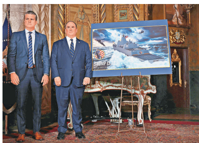
■ 費倫（右）與防長海格塞斯長期不和。