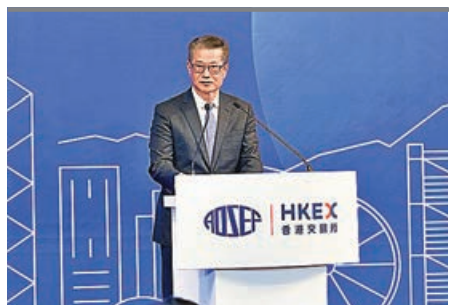
■陳茂波指，香港與全球20個交易所簽訂互認協議，便利企業雙重上市。資料圖片

此外，業內人士認為，中國在智駕領域正定義全球行業標準。當中，以德系、日系為代表的外資品牌紛紛加碼，依託中國技術推動轉型。提供智能駕駛解決方案的Momenta在車展正式發布Momenta R7強化學習世界模型並實現量產。截至目前，Momenta已交付逾70款量產車型，搭載其智駕方案的量產車輛規模突破80萬輛。在是次北京車展，有超過20個品牌、60餘款車型搭載Momenta方案，覆蓋奔馳、奧迪、寶馬等國際品牌。