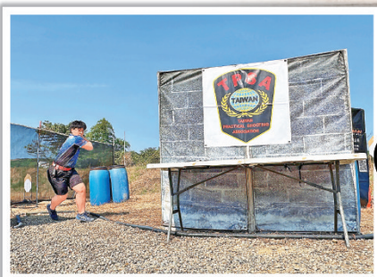
■ IPSC 的比賽場地包括室內與戶外。

笑指：「因為這項運動極考反應，長年訓練下我的反應也比別人快，這也是意外收穫吧！」