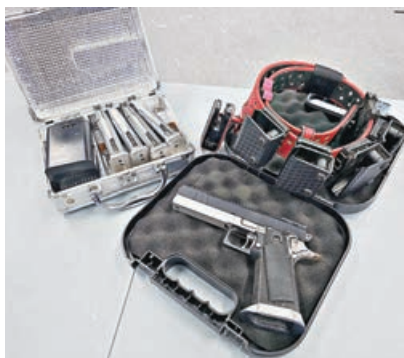
■ IPSC 基本裝備包括氣槍、彈匣及腰帶。

手拿氣槍專注射擊形象帥氣，不過亦有人因為害怕槍枝或是覺得費用高昂而對 IPSC 卻步。梁銘津直言這項運動入門的門檻並不高，而且在訓練中不僅提升技術，亦會培養良好的觀察力及情緒管理能力，成為最大得着。