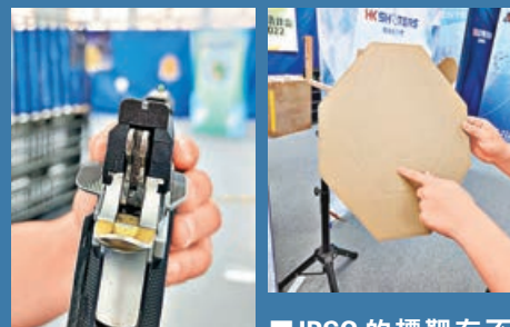
■ 標準組的氣槍不可使用光學瞄準鏡，考驗射手功力。

參與 IPSC 運動時，氣槍、彈匣、腰帶等器材皆可租借，但必需的消耗品如BB彈、為彈匣提供推力的氣罐等則需要自行購買，一般市售BB彈數十元就有一大包。