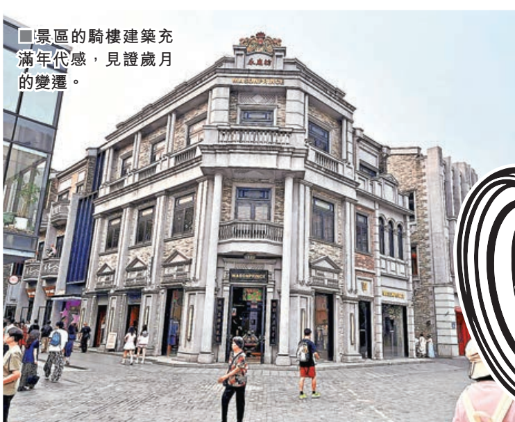
■景區的騎樓建築充滿年代感，見證歲月的變遷。

廣州是結合現代新地標與嶺南文化的旅遊城市，當地除了歷史文化勝地，大型商場、新派標誌性建築也一應俱全。當地美食亦以清淡為主，貼近大家口味。至於玩樂景點亦不少，最具代表性首推海珠區被稱為「小蠻腰」的廣州塔，基本上這是各地旅客到訪廣州的必到景點。廣州塔位於廣州市新中軸線與珠江景觀軸的交匯處，是一座集都市觀光、高空玩樂、廣播、餐飲及購物一體的綜合性電視塔。廣州塔總高度達600米，是目前中國第一、世界第3高的旅遊觀光塔，登上戶外觀景台，可360度無障礙俯瞰羊城全貌，晚上的夜景更是醉人，入場門票價格由¥150至¥400不等。