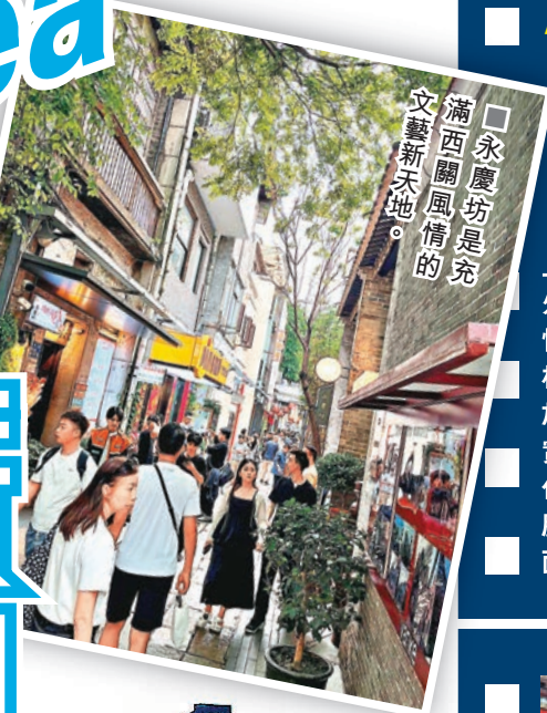
■永慶坊是充滿西關風情的文藝新天地。