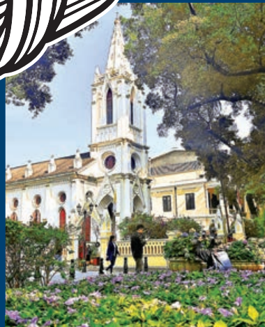
■沙面的教堂體現清末租界的特殊風貌。