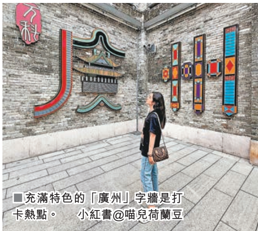
■充滿特色的「廣州」字牆是打卡熱點。