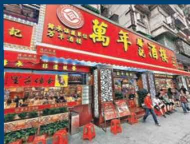
■老字號酒家可體驗到最地道口味。

想感受歐洲小鎮風情，距離永慶坊不遠的沙面島（簡稱沙面）亦屬於廣州老牌熱門景點，位處廣州地鐵黃沙站附近，距永慶坊約2公里，大家步行亦可前往。沙面見證近代史的滄桑變遷，島上保存眾多歷史建築，如海關館舍、廣東外事博物館，每一座建築都承載歲月的記憶。這些建築風格各異，包括巴洛克風格、羅馬風格。漫步Hea遊沙面彷彿置身於歐洲小鎮，是一次建築藝術的饗宴。事實上，沙面融合了歐洲文化與廣州本地文化，形成了一種獨特的交融氛圍。這種具歷史痕跡的景區在內地絕不多見，因此沙面也成為不少遊客必到之地。